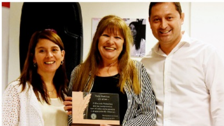
Homenajes a mujeres destacadas