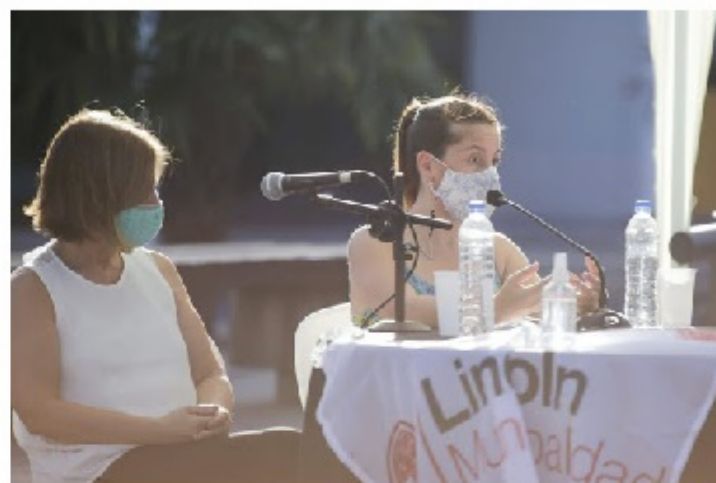
Promoción de los Derechos de las Mujeres